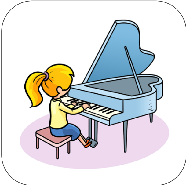
Dziewczynka gra na fortepianie.