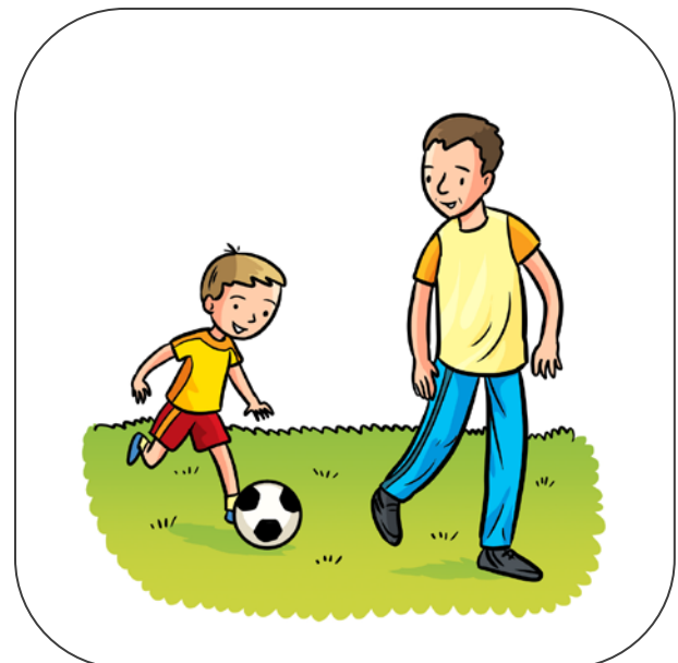
Tata gra z synem w piłkę nożną.