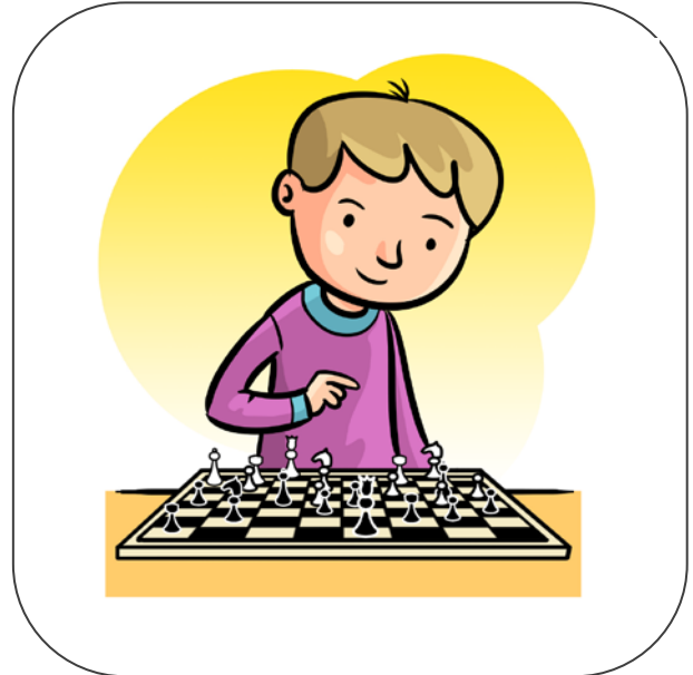
Chłopiec gra w szachy.